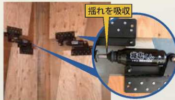
Hi ダイナミック制震工法 / 設置例

●1カ所当りの標準施工費 ¥150,000~ ※30坪の家に平均8カ所 (住宅により異なります。)